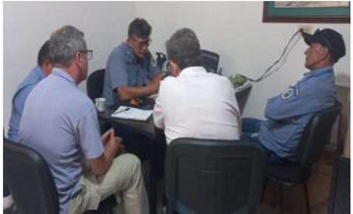
Sede administrativa PNNC – Municipio de Tibú, N de S. Lunes, 25 mayo 2026.

En el caso de PNN Catatumbo Barí se viene evaluando la consolidación de la propuesta: