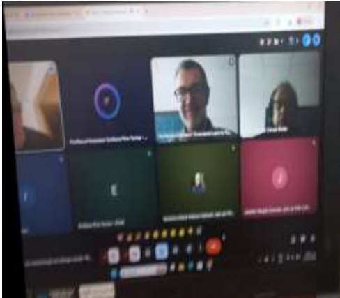
Reunión virtual - link de conexión.

LUGAR. Oficina PNN Catatumbo Barí oficinas Tibú.